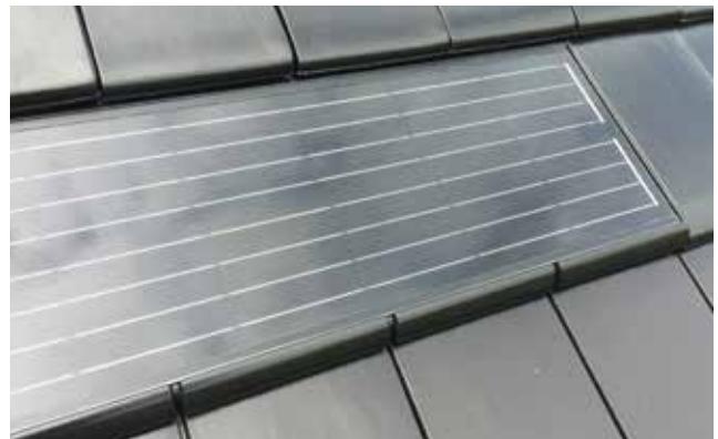
Neu! G10 PV und G10 2 Power