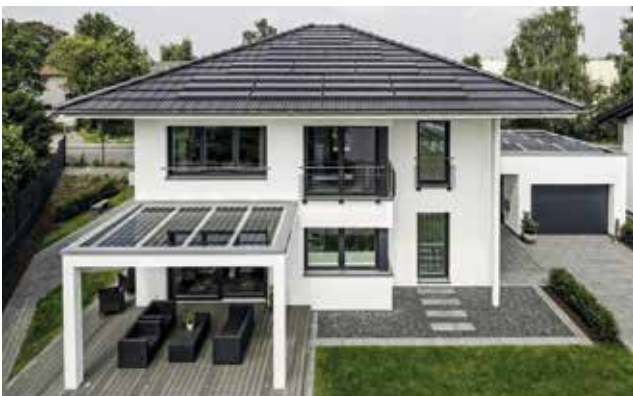
MS 5 PV und MS 5 2 Power Ästhetischer Strom bzw. Strom und Wärmeproduzent