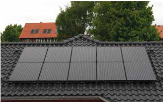
2 Power Strom und Wärme - ein Modul