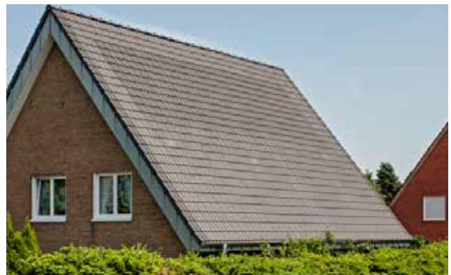
SolarPowerPack Heizen mit der Energie vom Dach